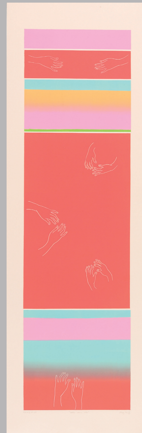
Dotik-zelena črta, 2005, barvni linorez, 100 cm x 32 cm, foto: Brane Božič