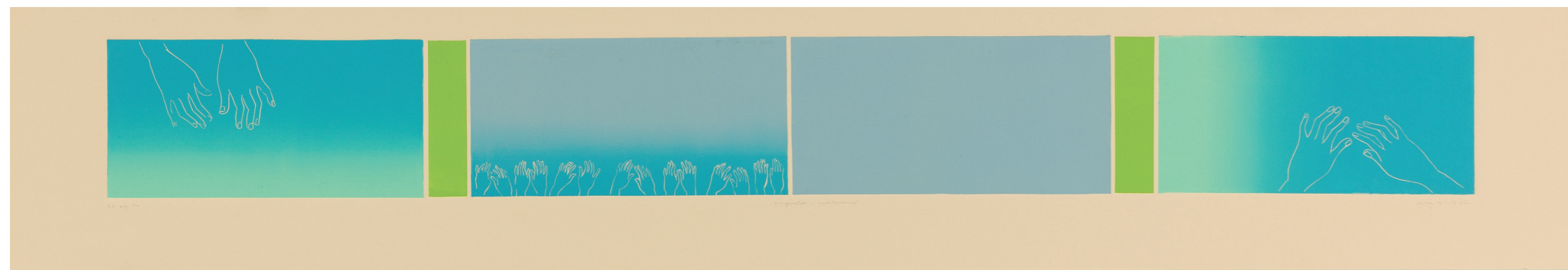
Fitzgeraldo Mediteraneo, 2006, barvni linorez, 35 cm x 100 cm