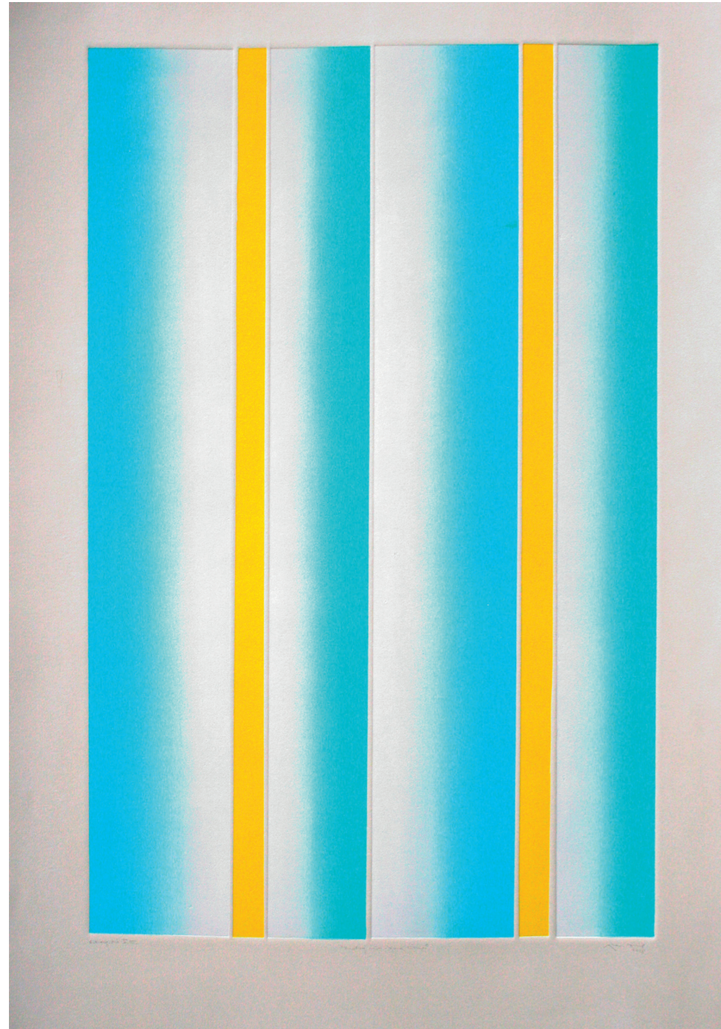
Znotraj mir - zunaj tišina, 2018, barvni linorez, 100 cm x 70 cm